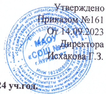
График подготовки к олимпиадам на 2023-2024 уч.год